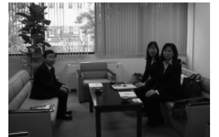
インタビューを終えて