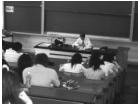
講演中の新倉会長