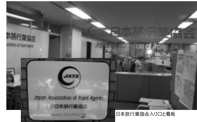
日本旅行業協会入り口と看板

ます。これも重要です。また、今まで日本の観光地には一番欠けていたところですが、地域には独特の街並み、雰囲気作りが必要です。政府の活動が観光に振り向けられてきたことは歓迎すべきですが、地域の振興はあくまでも地域主導で行っていくべきです。その際、旅行会社は地域と連携して活性化に役立てると思います。